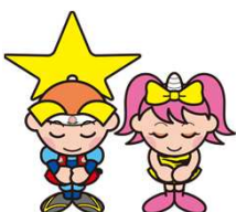
岡山県マスコット ももっち・うらっち